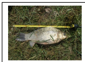
Karas stříbřitý 42 cm

Díky vyššímu stavu vody na Cidlině začaly na jejím spodním úseku brát dobře ryby. Několik rybářů tohoto využilo a dočkali se i hezkých a zajímavých úlovků.